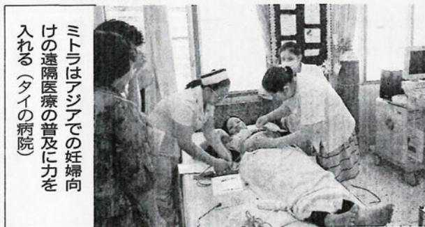
ミトラはアジアでの妊婦向けの遠隔医療の普及に力を入れる(タイの病院)