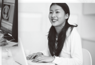
生涯健康カルテや個人医療記録を自宅で確認