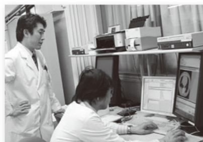
送られた画像を見る 香川大学医学部附属病院の医師

そうした趣旨から、周産期電子カルテネットワークやモバイル胎児心拍モニターによる在宅妊婦管理システムの開発など、医療ITで全国に先駆けている香川大学医学部が中心となり、地域の力を結集させて2004年6月にスタートさせたのが、かがわ遠隔医療ネットワーク「K-MIX」です。医療崩壊を救うこの画期的な仕組みは、2011年度からの小学校教科書にも掲載されるなど、これからの地域医療を支える社会基盤として注目されています。